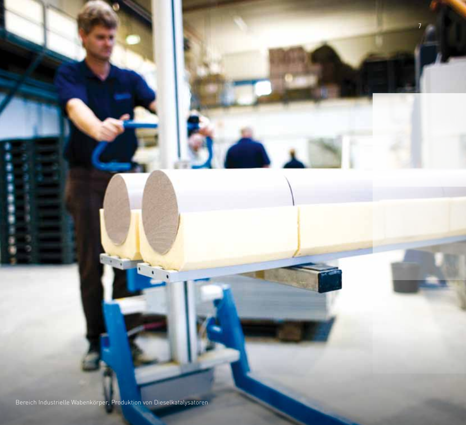
Bereich Industrielle Wabenkörper, Produktion von Dieselmotorkatalysatoren

Die Diversifikation der Fraunhofer-Gruppe bewährt sich nachhaltig, auch in der Phase der Markterholung und Konsolidierung. Die sich sehr gut entwickelnden Divisionen Großhandel für Sanitär- und Heizungsprodukte und Industrielle Wabenkörper sowie die sich zunehmend stabilisierende Division Automotive Components werden der Gruppe eine signifikante Verbesserung des Jahresergebnisses gegenüber 2009 ermöglichen. Die Erzielung eines deutlich positiven Jahresergebnisses rückt in den Bereich des Möglichen, falls sich die wirtschaftlichen Rahmenbedingungen im 4. Quartal nicht verschlechtern. Aufgrund der saisonalen Verteilung des Geschäftsverlaufs ist eine Hochrechnung des aktuellen Halbjahresergebnisses auf das Jahresergebnis 2010 nicht möglich. Wachstumschancen ergeben sich in allen Divisio-